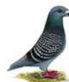
Show Racer rotfahl-gehämmert 1.1 alt