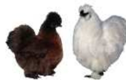
Zwerg-Seidenhühner m.Bart weiß 1.2 jung