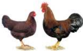
Zwerg-Welsumer rost-rebhuhnfarbig 1.2 jung