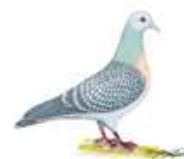
Coburger Lerche silber m.Binden 1.1 jung