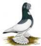
Märkische Elstern OCR 4.4 jung