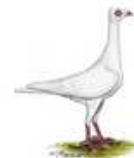
Stralsunder Hochflieger weiß 1.1 jung