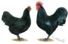
Australorps schwarz Westphal, Günter